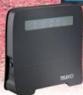
Wifi - Router