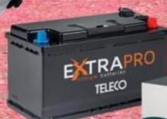
Batterie al litio