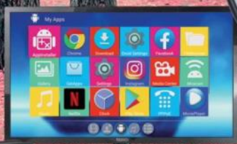
Televisori e Smart TV